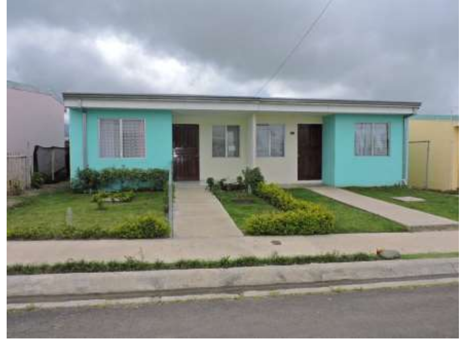
Proyecto de vivienda Los Recuerdos, Jiménez de Cartago.