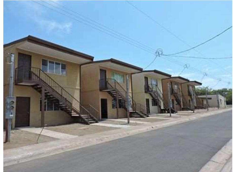
Proyecto de vivienda Génesis, Chacarita de Puntarenas.